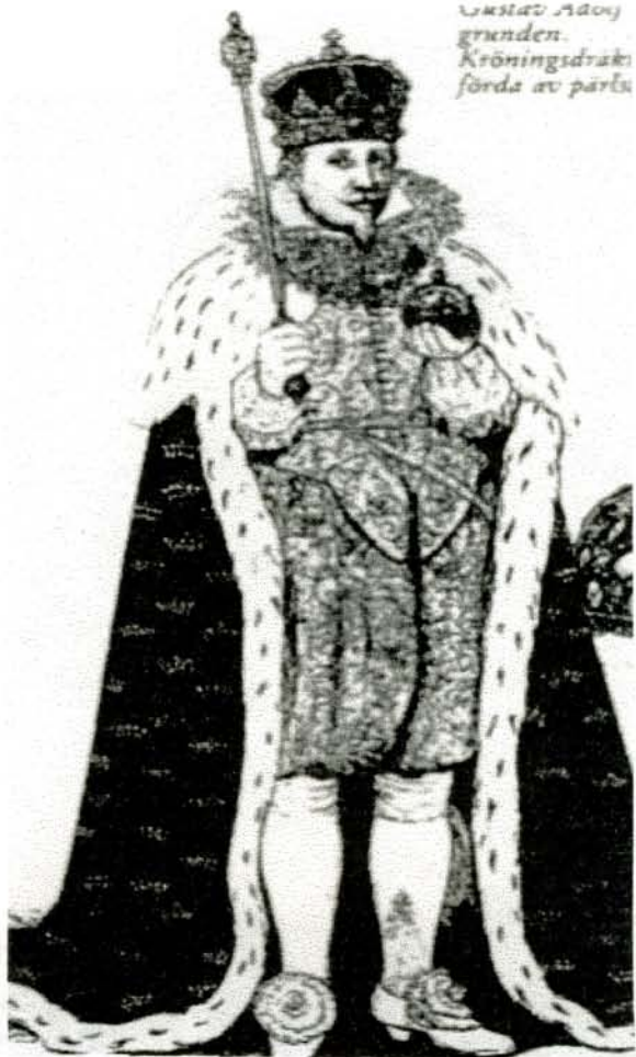
Gustaf Adolf grunden. Kröningsdrakt förda av parva