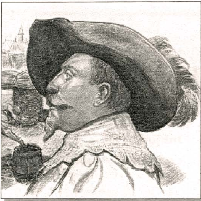
Gustaf II Adolf